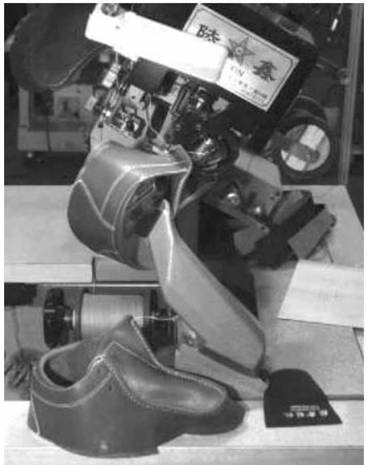
چین در سال ۲۰۱۰ میلادی ۱۲/۶ میلیارد جفت کفش تولید کرد

بازهم طبق آمار ( CLIA ) می دانیم که چین ۱۵/۶ میلیون جفت کفش چرمی در سال ۲۰۱۰ وارد کرده است که حدود ۰/۵ درصد کل مصرف است. چین مقداری هم کفش های غیر چرمی وارد می کند ولی باز هم این مقدار ناچیز است. بنابراین به نظر می رسد که نظریه ی آپیکاپس درست باشد و فقط در مورد رقم ۱۰ درصد برای سهم پایپوش های چرمی از کل صادرات کفش سؤال وجود دارد. آپیکاپس می گوید این رقم را از رابط های صنفی شان در چین به دست آورده اند اگر این رقم دقیق باشد ۲۰ میلیارد جفت درست است ولی اگر دقیق نباشد کل استدلال ها زیر سؤال می رود.