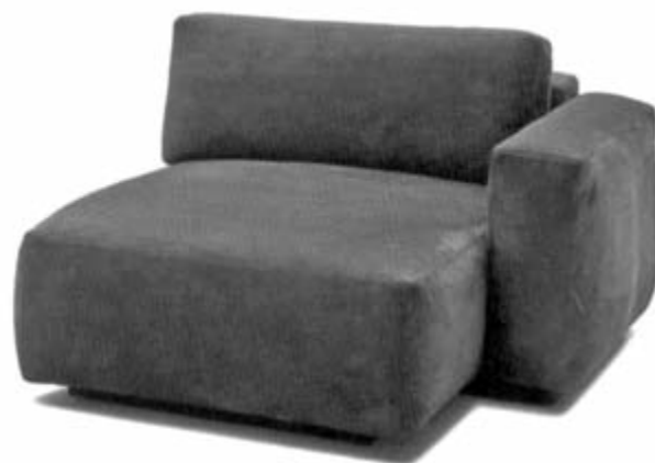
کاناپه کومولوس کار طراح آلمانی گابریل آسمن

چارپایه‌ی زیرپایی سمت چپ است و برعکس. زیرپایی‌ها کروم‌پوش هستند. دو مدل لئولوکس به نام‌های «پالون» و «کولانا» نامزد جایزه نوآوری داخلی ۲۰۱۰ شده‌اند که جایزه‌ی معتبری در آی‌ام‌ام است.